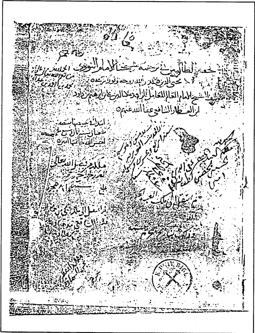
صورة عن طرة النسخة المعتمدة في التحقيق